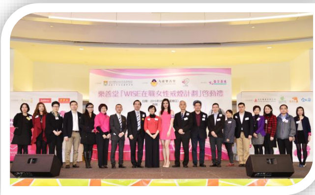
一眾支持及參與機構與樂善堂一同積極推動女性戒煙運動